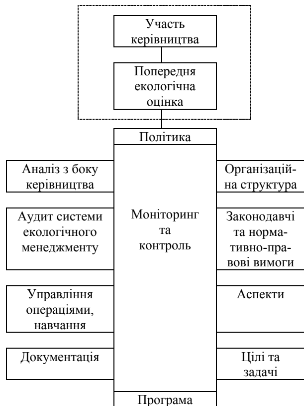
Рис. 2. Етапи впровадження і функціонування системи екологічного менеджменту

ня керівних положень і правил з метою впорядкування діяльності в природокористуванні, забезпечення екологічної безпеки підприємства [2].