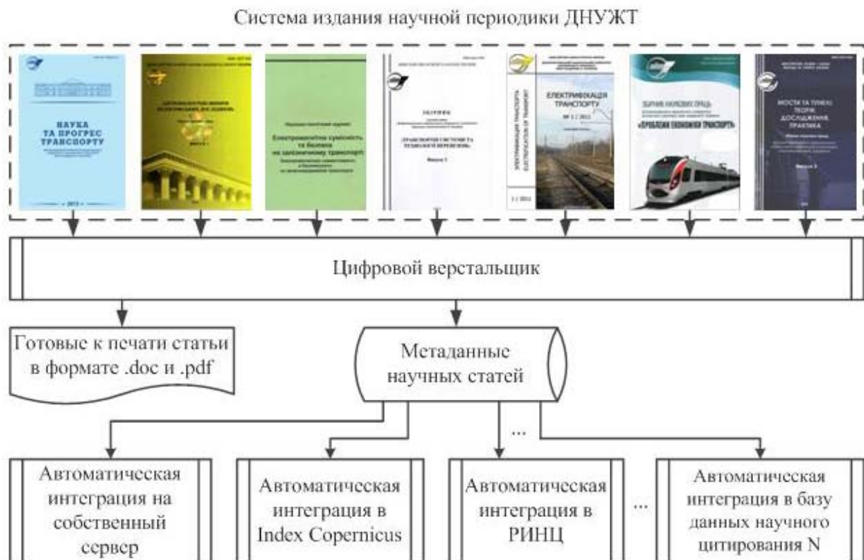
Рис. 1. Система видавання наукової періодики ДНУЖТ, заснована на змішаній моделі публікації «Epub ahead of print»

З урахуванням запуску програми «Цифровий верстальщик» система видавання наукової періодики ДНУЖТ може бути представлена в вигляді, зображеному на рис. 1.